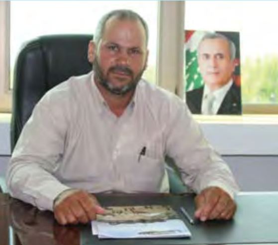
رئيس بلدية عيتيت الاستاذ يوسف محسن

المجلس البلدي، وشق طرقاً زراعية، حضر بئر مياه ثانية، إضاءة ملعب رياضي لأبناء البلدة بمواصفات مميزة، دعم المدرسة الرسمية، معالجة مؤقتة لمشكلتي الصرف الصحي والنفايات، إضافة إلى شراء قطعتي أرض لتوسعة الساحة العامة وباحة النادي الحسيني، والثانية أضيفت لجانة البلدة، كما تم تعبيد الطرق الداخلية وتشجير مداخل البلدة إضافة إلى إنجاز العديد من جدران الدعم والتجميل».