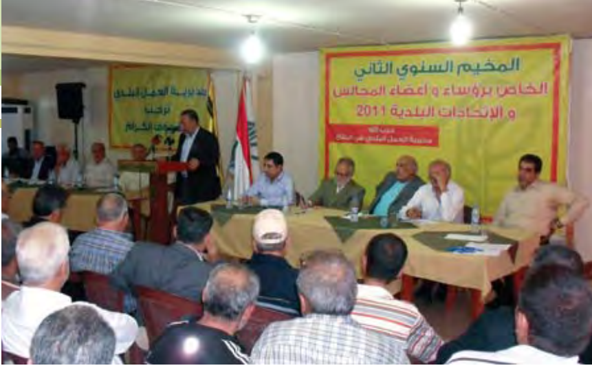
توصيات هامة صدرت في ختام اللقاء

محطة صرف صحي في تمين. وسيستفيد من هذه المحطة كل من البلديات التالية: بعلبك، كفردان، طاريا، شمسطار، النبي رشادة، حزين، بريثال، طليبا، الخضر، النبي شيت، الخربية، علي النهري، تمين، بدنايل، قصرنبا، تمين الفوقا، النبي أيل، رياق، حي الفيكاني، ماسا وعين كفرزبد. إضافة الى تسريع العمل والبدء بمعمل فرز النفايات في بعلبك.