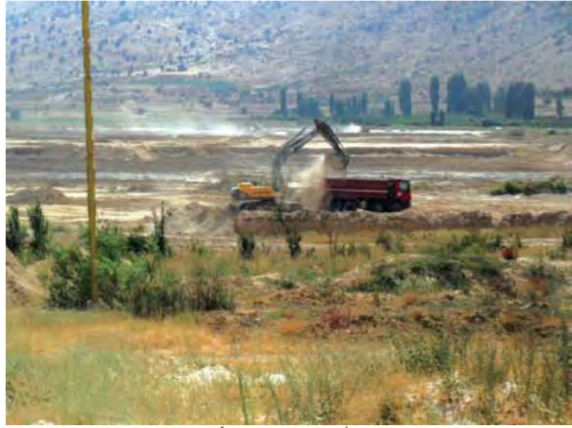
الأعمال في مشروع السد

الى اعادة تنفيذ لان اقل تسرب منها يصل الى المياه، فضلا عن ان هناك العديد من البيوت القريبة من المياه تقيم حفرا صحية ايضا تتسرب الى المياه. مشددا على العامل الانساني في التلوث، حيث يجري استخدام المياه الجارية والمكشوفة (متنزّهات، رحلات) واستخدامات أخرى مختلفة: غسيل اوان وامتعة مضافا اليها غسيل الحيوانات وريها ما ينتج عنه تلوث اضافي، وحتى لو ازيلت المجاري والجور فان التلوث يبقى حاصلًا خاصة في فصل الصيف. ثانيا الري: يشير عساف الى ان اليمونة ورغم وجود النبع فيها الا ان هناك منطقة كبيرة شمالي اليمونة (سهل بمساحة 4000 دونم) تروى بواسطة الابار الارتوازية ما يزيد في كلفة الانتاج الزراعي نظرا لغلاء المواد.