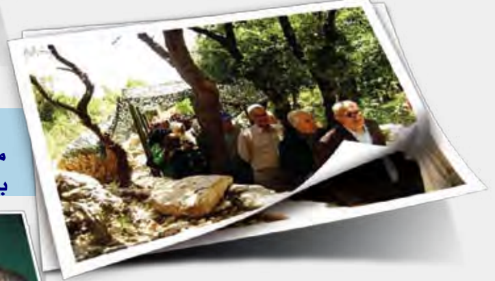
رحلة إلى المعلم الجهادي في مليتا نظمتها بلدية شقرا لأبنائها بمناسبة عيد المقاومة والتحرير