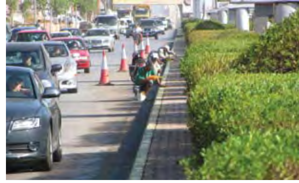
إهتمام بالبيئة والتجميل