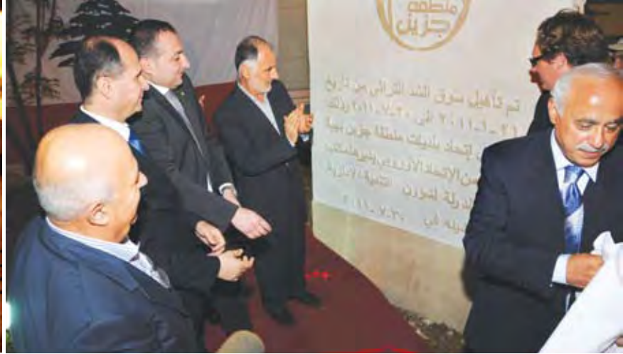
الوزير فنيش وحرفوش خلال افتتاح سوق السد التراثي

خاصة، كما أننا سنعمل على الاراضي غير المستثمرة لايجاد مستثمرين لها».