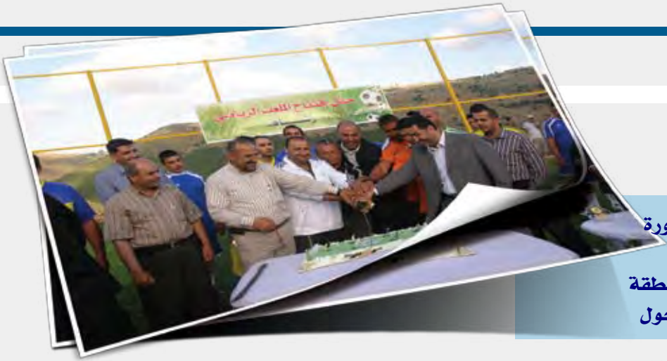
إفتتاح ملعب رشاف الرياضي بدورة رياضية مميزة أقيمت برعاية مدير العمل البلدي في منطقة الجنوب الأولى الشيخ فؤاد حنجول