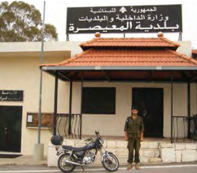
مركز البلدية الحالي