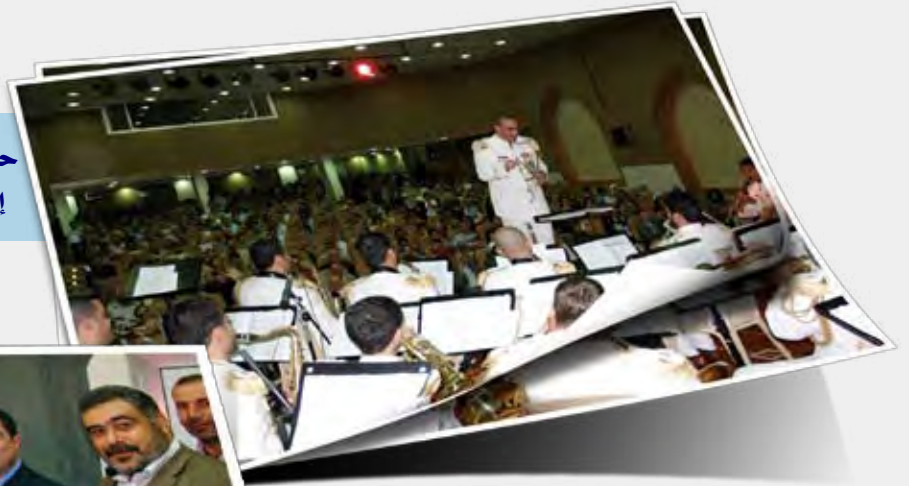
وزير الزراعة د. حسين الحاج حسن رعى إطلاق مهرجان الهرمل الثقافي بدعوة من إتحاد بلديات الهرمل في تموز الماضي