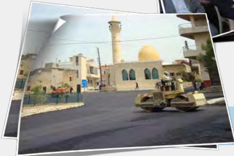
ساحة بلدة باريش في حلتها الجديدة بعد إعادة تأهيلها مطلع الصيف