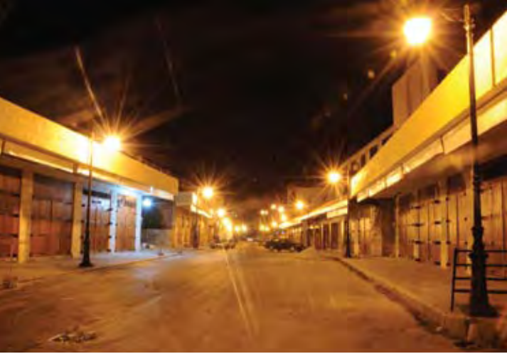
سوق جزين ليلاً