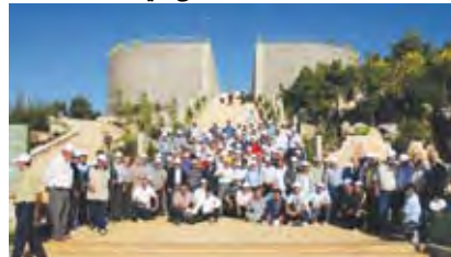
صورة تذكارية لوفد البقاع

بلديات البقاع في الجنوب، مشدداً على الاهتمام بانماء المناطق، وقال ان: «الواجب الوطني يفرض على الحكومة أن لا تنجر إلى إستنزاف ومن زلقات داخلية، وعليها أن تتفرغ لخدمة الناس ومعالجة الأزمات ومواجهة التحديات».