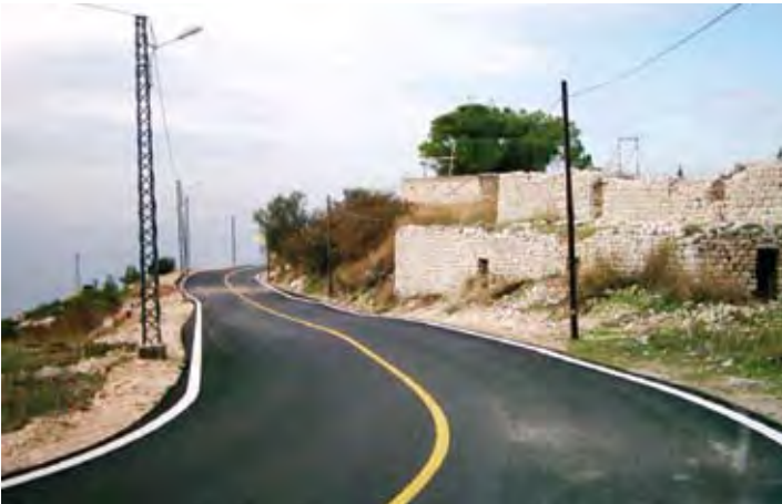
المعاصرة بوابة الفتوح - كسروان

تنتشر على اطراف نهر ابراهيم مجموعة من المصانع والمعامل التي سبق وجودها التصنيف السياحي للمنطقة، وهي موزعة كالآتي: مصنع المينيوم (عدد 1)، مصنع اخشاب (عدد 3)، معمل بلاط (عدد 1)، معمل حديد (عدد 2).