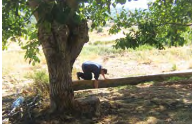
صيانة أقنية المياه