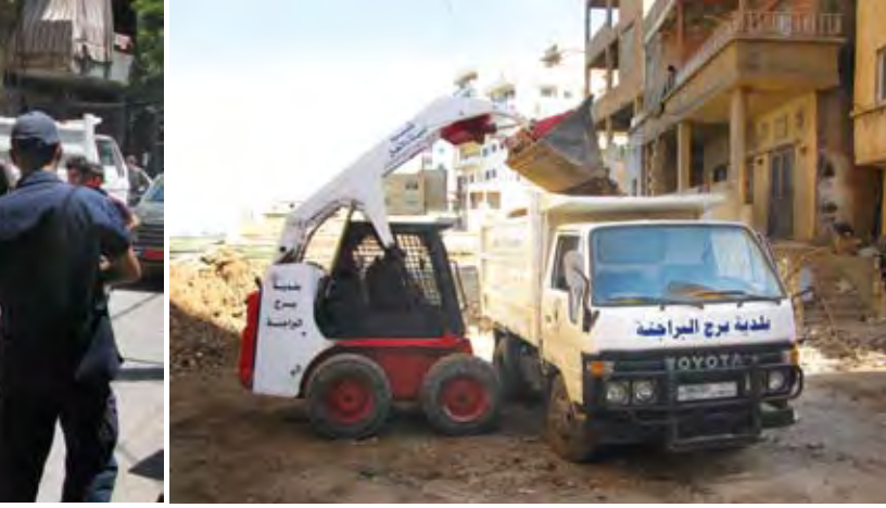
متابعة للاشغال والصيانة