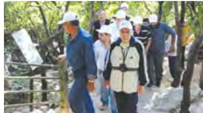
وفد بلديات البقاع في مليتا