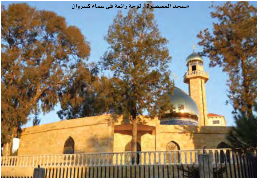
مسجد المعاصرة.. لوحة رائعة في سماء كسروان