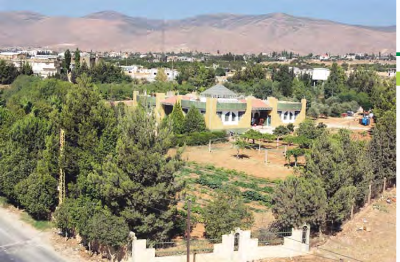
مركز الجواد التابع لمؤسسة جهاد البناء يعني بالتنمية المحلية في الهرمل

واستكمالاً لخطته، تعقد طاولة مستديرة لعرض المشاريع، التي تم اعدادها، على جهات مانحة محلية، عربية ودولية.