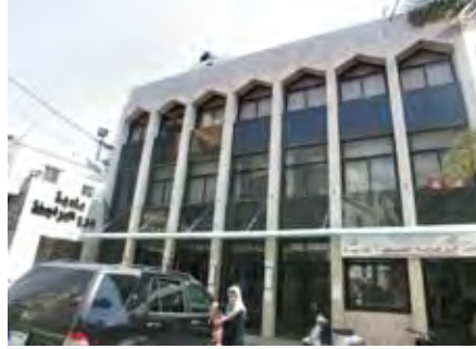
مركز بلدية برج البراجنة

موقع بلدية برج البراجنة على شبكة الانترنت www.borjalbarajneh.org