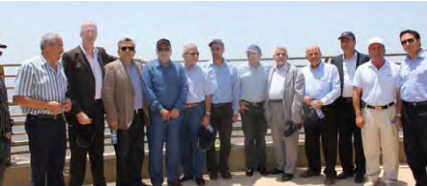
نواب ورؤساء بلديات من بعيدا في مليتا