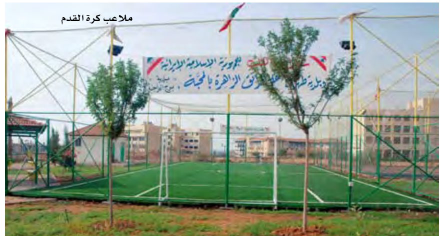
ملاعب كرة القدم

ويشير رئيس البلدية إلى أن «لجنة التربية تتعاون مع الإنعاش الاجتماعي لضبط التسرب المدرسي وإقامة دورات دعم وتقوية للتلاميذ الذين يحتمل تركهم المدرسة. كما قامت اللجنة نفسها بالتعاون مع التهيئة التربوية بإقامة دورات تقوية ودعم للمرشحين للامتحانات الرسمية،