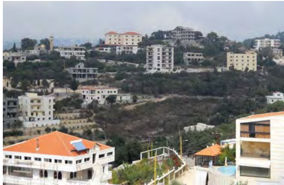
تشهد البلدة تطوراً عمرانياً

«مشروعاً ملحاً خاصة بعد الحادث الذي اودى بحياة مواطنة من أبناء البلدة». تلك المشاريع التي أنجزتها البلدية أو التي تسعى لانجازها تتطلب ميزانيات هامة اعتمدت البلدية لتأمينها على المقدر لها من الصندوق البلدي المستقل بالإضافة الى مردودات القيمة التأجيرية والحماية المفعلة في البلدة بنسبة 85 في المئة. كما سعت البلدية لتنفيذ بعض المشاريع عبر وزارات الطاقة والمياه، النقل والاشغال العامة والشؤون الاجتماعية. تصنف بلدة المعصرة ضمن البلدات السياحية الامر الذي يجعل الاهتمام بالبيئة