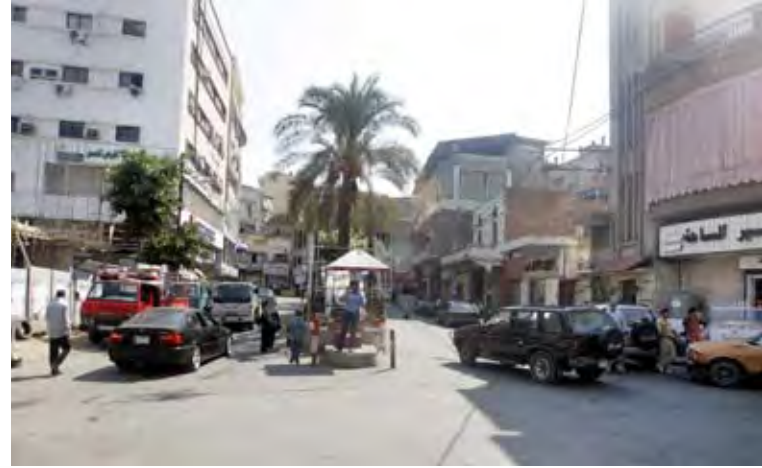
ساحة عين السكة