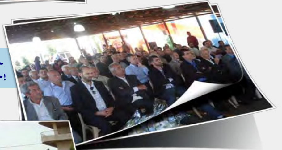
حفل شعري أقامته بلدية مارون الراس إحتفالاً بذكرى الإنتصار في أيار الماضي