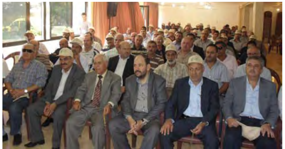
الحضور في حفل افتتاح المخيم

تحوّل المخيم السنوي الذي تقيمه مديرية العمل البلدي لحزب الله في البقاع الى مؤتمر بلدي تنموي للمنطقة، فقد كان المخيم فرصة مؤاتية للبلديات لطرح قضاياها ومشاكلها والبحث عن حلول ممكنة، خاصة مع وجود نواب المنطقة الذين التقوا البلديات في ورشة تنموية تطرقت الى كل المشكلات التي تعاني منها المنطقة.