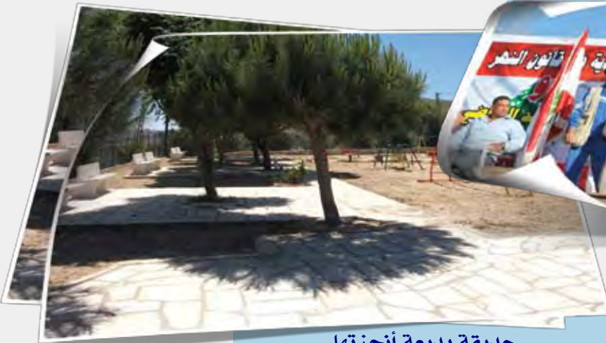
حديقة بديعة أنجزتها بلدية خربة سلم