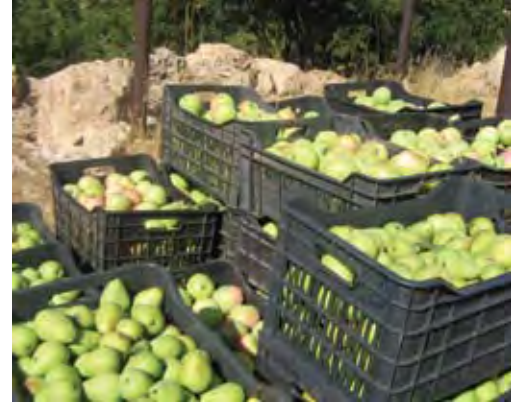
الزراعة في اليمونة

من المياه بشكل دائم في البركة للاستفادة منها بالسياحة اولاً، وثانياً لعدم تحولها الى بؤرة تلوث ومرتع للضفادع والقوارض والحشرات، بالإضافة الى عدم وجود دراسة لاقامة بنية تحتية من انارة وارصفة وطرقات بل هناك عملية تكديس للتربة بشكل يجعل البركة مستقماً ومجمعا للمياه تجف عند انحسار المنسوب اذ ان مستواها العمقي بمستوى النفق الذي يسرب المياه.