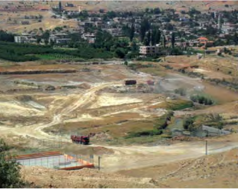
موقع المشروع وتبدو بلدة اليمونة