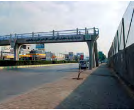
جسر المشاة فوق طريق المطار