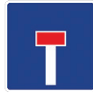
طريق غير نافذ