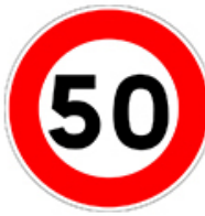
أقصى سرعة مسموح بها