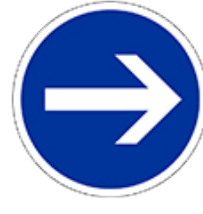
اتجاه سير اجباري إلى اليمين