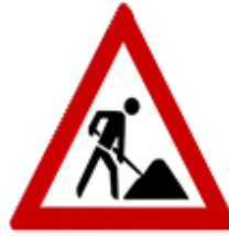
أعمال على الطريق