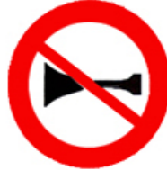
ممنوع استعمال المنبه