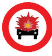
ممنوع دخول المركبات التي تحمل مواد متفجرة أو شديدة الاشتعال