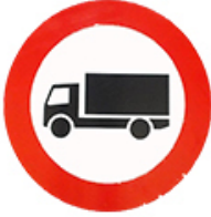
ممنوع دخول الشاحنات