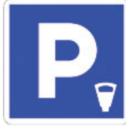
وقوف مقابل بدل