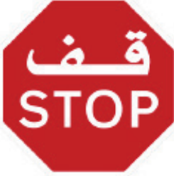
توقف عند التقاطع