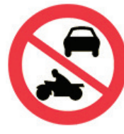
ممنوع دخول السيارات والدراجات الآلية على أنواعها