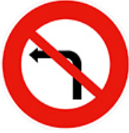
ممنوع الالتفاف شمالاً