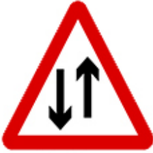
انتبه منطقة سير على خطين