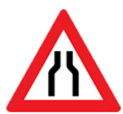
الطريق يضيق من الجانبين