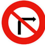
ممنوع الالتفاف يميناً