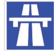
بداية طريق سريع