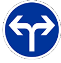
اتجاه اجباري إلى اليمين أو إلى اليسار