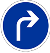
اتجاه اجباري إلى اليمين