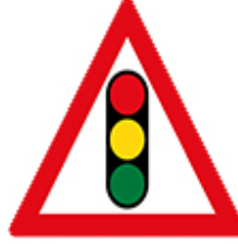
انتبه اشارات كهربائية