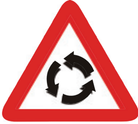
حركة سير دائرية مستديرة