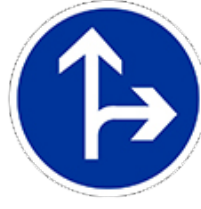
اتجاه اجباري مستقيم أو إلى اليمين