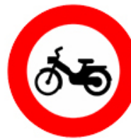
ممنوع دخول الدراجات الآلية