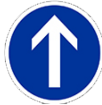
اتجاه اجباري مستقيم