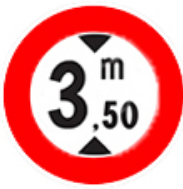
ممنوع مرور المركبات التي يزيد ارتفاعها عن الرقم المحدد