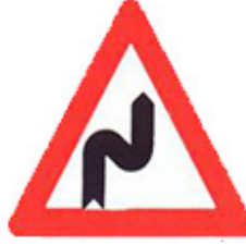
منعطفات خطيرة من اليمين إلى اليسار