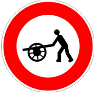
ممنوع دخول العربات التي تجر باليد