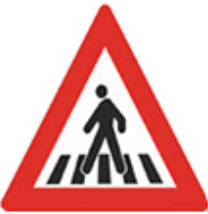
انتبه ممر للمشاة