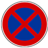
ممنوع التوقف والوقوف